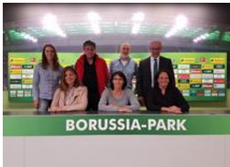
Grenznetz besucht 2017 den Borussia Park in Mönchengladbach