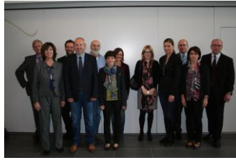
Grenznetztreffen Padborg 2013