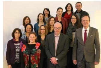
Grenznetztreffen in Oberkirch 2019