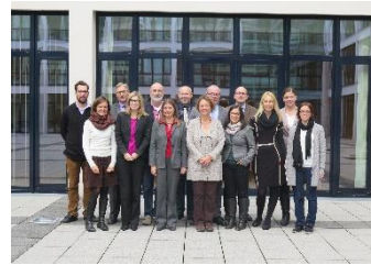
Grenznetztreffen in Kehl und Saarbrücken 2014