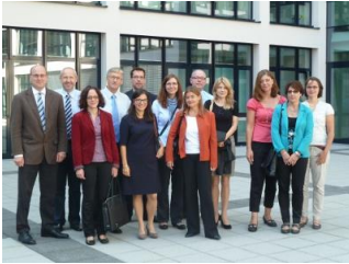
Grenznetztreffen Aachen 2012