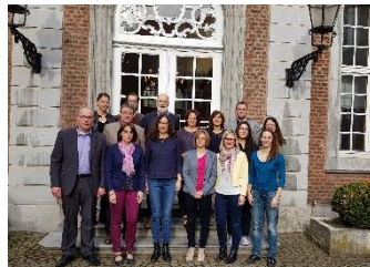
Grenznetztreffen in Eupen 2018